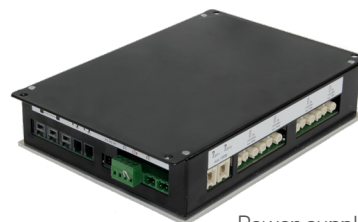
Power supply unit